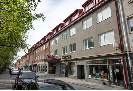
Prästgatan 50B Objektreferens: 5201913005